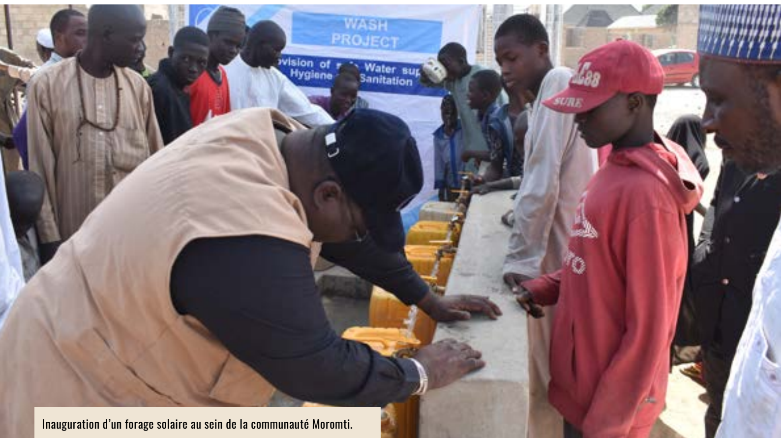
Inauguration d'un forage solaire au sein de la communauté Moromti.