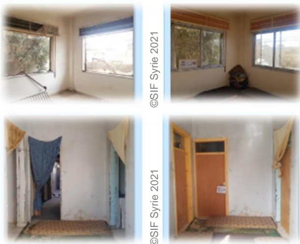
Exemples de logements avant / après réhabilitation